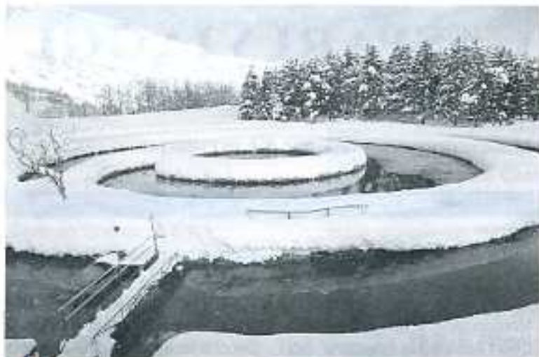
Peschiera di Febbio - Rifugio Zamboni

l'emigrazione costringe a brevi ritorni nel periodo delle ferie.