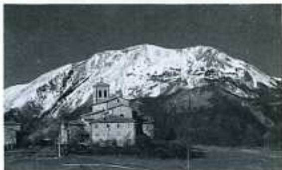
Chiesa di Minozzo

L'abitato è costituito da due nuclei di edifici ad impianto indifferenziato. La chiesa parrocchiale sovrasta l'abitato ed è caratterizzata da un'ampia facciata a sviluppo verticale rivolta ad oriente, recante numerosi conci di pietra orsata probabilmente appartenenti ad una più antica costruzione. Una finestrella riquadrata, a livello