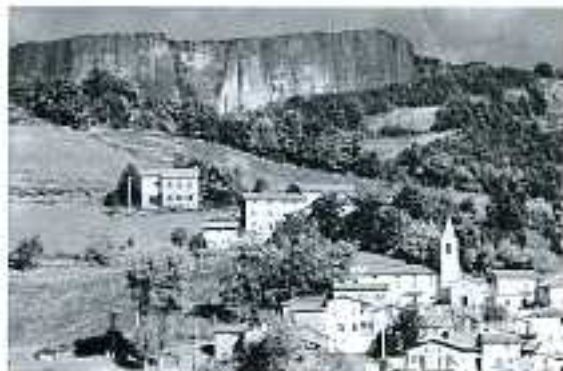
Poiano e la Pietra di Bismantova