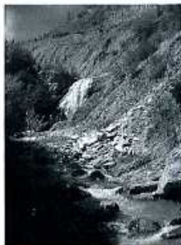
Cascata del Golfarone.

Dalle vecchie sagre tradizionali poco o nulla si salva, poiché