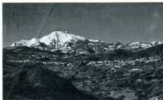
Sologno - Il Ventasso