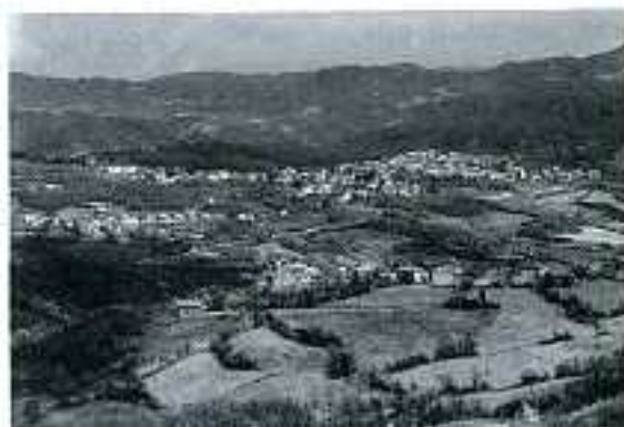
Secchio di Villaminazzo

La chiesa di S. Martino compare solo nella visita Pallavicini del 1456. Si dice che l'antica chiesa parrocchiale di trovasse a circa mezzo chilometro dalla attuale e che rovinasse a causa di una frana. Una relazione del 1674 riporta come essa fosse una delle più belle chiese dell'alta montagna. La visita del Vescovo Picenardi del 1707 la descrive rivolta ad oriente con una unica navata e tre altari. La chiesa è stata ricostruita nel 1822 con tre navate in volto e cinque altari. Presenta una facciata a