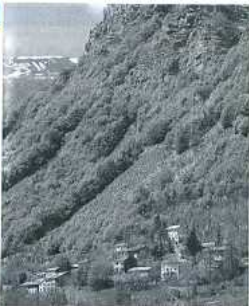
Case di Civago

Da ciò il caratteristico detto civaghino Tva a truvaa furs da minar a Modna , per indicare un'impresa molto difficoltosa.