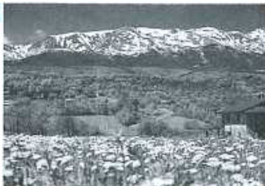
Val d'Asta - Panorama

Il Parco del Gigante offre quindi a tutti bellezze naturali ed esperienze umane che possono essere conosciute attraverso itinerari suggestivi, visite interessanti e permanenze vissute in armonie con l'ambiente e la gente di montagna.