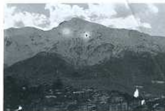
Costabona - Il Cusna